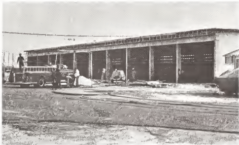
Esaki ta un di dos kasernenan cu a wordo construi den aña 1977 pa facilita e trabao di cuerpo di bombero. Ta conoci cu e departamento di bombero a bira completamente independiente di e cuerpo policial. E departamento ta situa banda di e aeropuerto bieuw.

Tur cos ta wordo haci pa banda di nos diputadonan pa pronto finalisa e estudio con pa realisa e proyecto di pesca mas eficientemente posibel. Di-